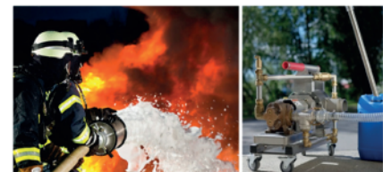
Dosificador Electrónico CTD