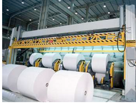
PULPA Y PAPEL