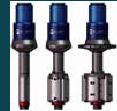
CRT (Casing Running Tool)

Estrella International Energy Services cuenta con experiencia y personal altamente calificado para ejecutar operaciones de corrida de revestimiento convencional y no convencional. Nuestros procesos están estandarizados de tal forma que permiten brindar un servicio eficiente en diferentes condiciones operativas.