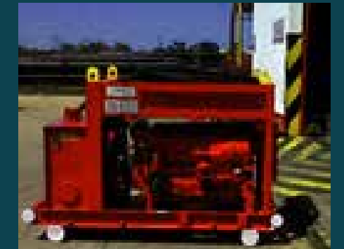
Unidad de Potencia Hidráulica