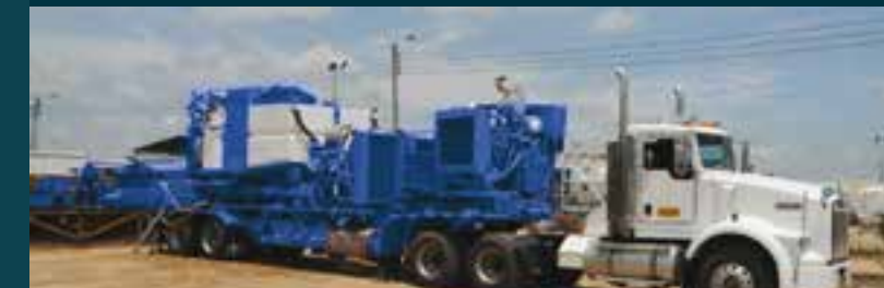
Unidades de Nitrogeno