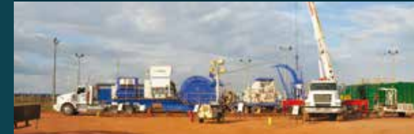
Unidades de Bombeo